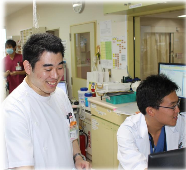
↑病棟で患者さんの処方提案