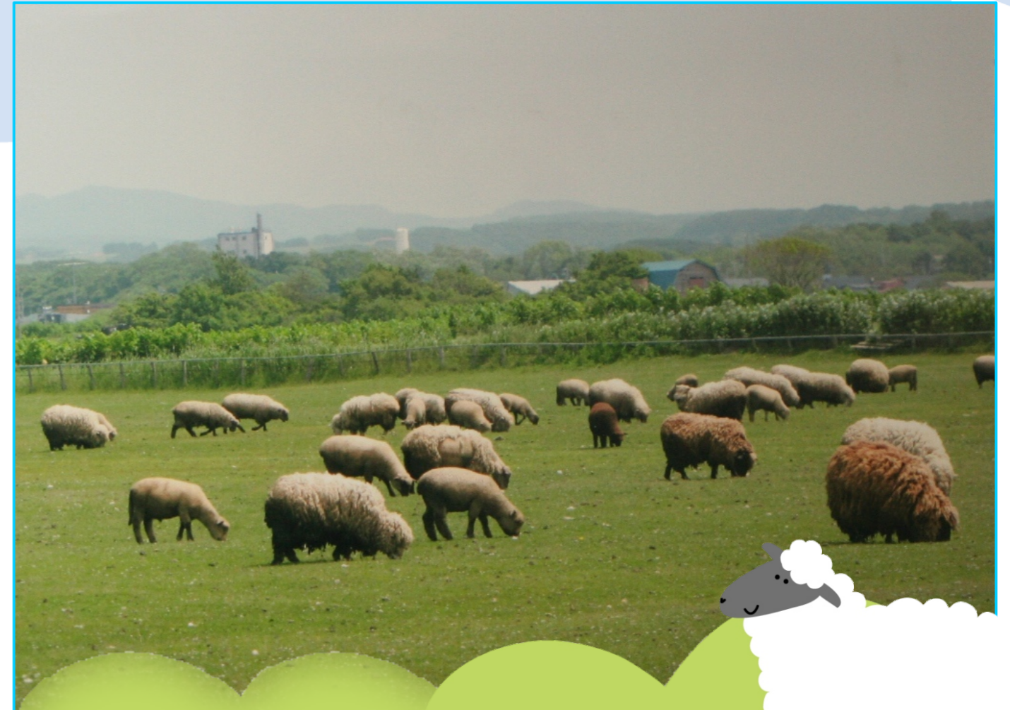
～富川羊牧場～