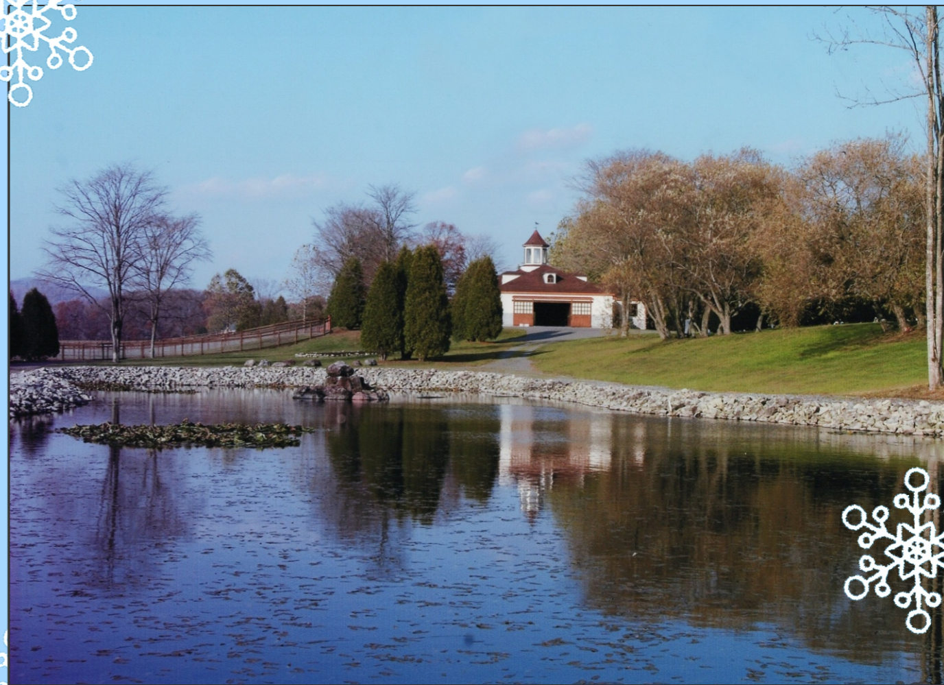
新冠・ビッグレッドファーム