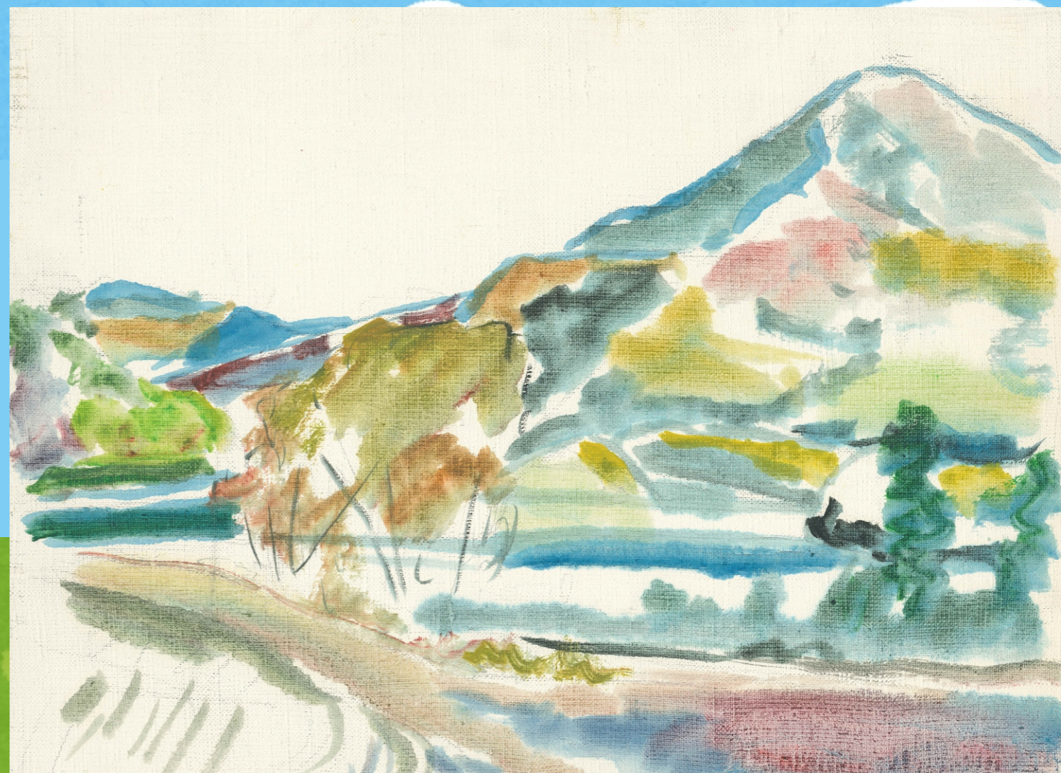
新ひだか町の風景